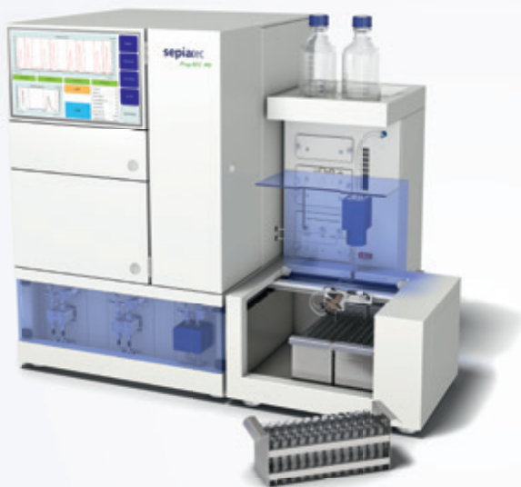
Prep SFC M5 主机配置 XY-收集器

系统主机集成了 15.6" TFT 触摸屏控制器，用于输入样品分离的参数设置及数据查看等。无需额外配置电脑主机，紧凑型设计将 Prep SFC M5 超临界流体色谱制备系统的宽度缩减至 92 cm。