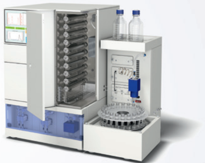
Prep SFC M5 主机配置转盘收集器