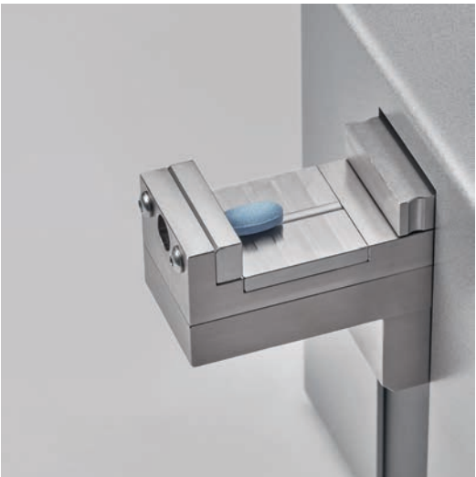
带凹槽的快换舌板，便于对齐凸形片剂

高度灵活的可扩展测试区域接受所有类型的形状、尺寸和材料。采用了优化的下槽设计缩短操作等待时间，而通过快换舌板，操作员可简单地进行片剂定位。夹槽设计扩展了 MT50 的测试功能，用于 3 点弯曲强度测试或其他测试方法。