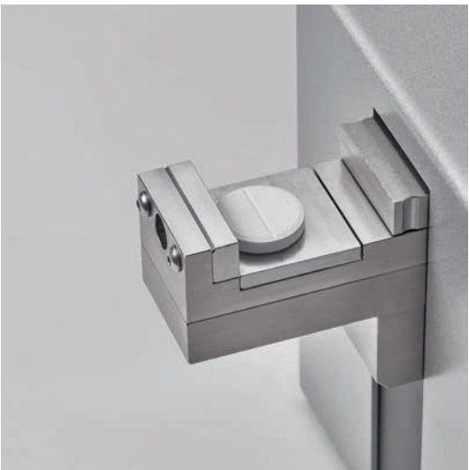
带平面的快换舌板