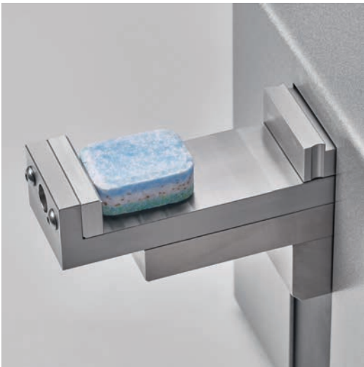
用于测试大型物体的扩展槽，可达 65 mm